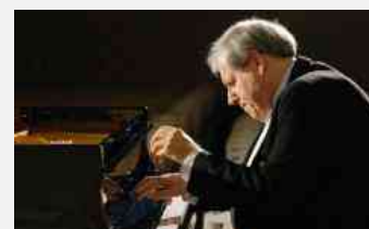
Opera di Firenze: Grigorij Sokolov in