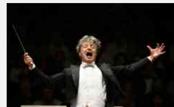
Maggio, il ritorno di Roberto Abbado col violino di Capuçon