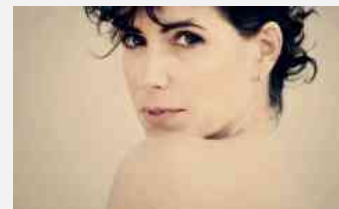
Mtv Awards 2014 a Firenze: punta sul rap l'appuntamento del 21 giugno